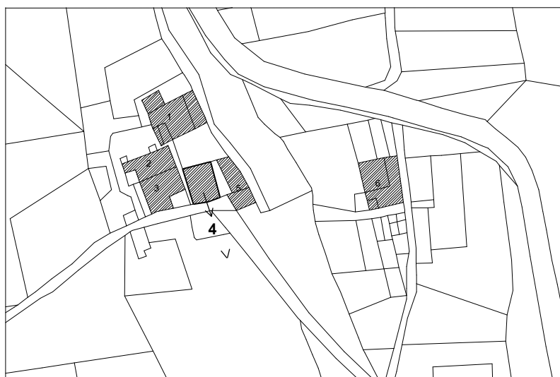
Estratto catastale in scala a vista

☺ > Punto di vista dell'immagine fotografica Perimetro dell'unità edilizia