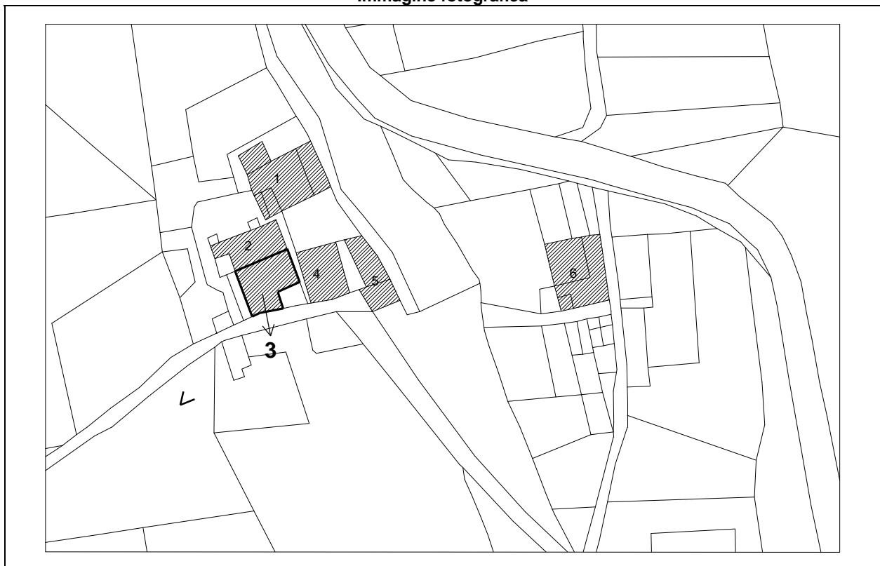
Estratto catastale in scala 1:1.000

☺ > Punto di vista dell'immagine fotografica Perimetro dell'unità edilizia